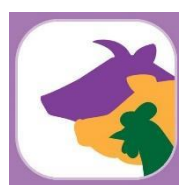
ฟาร์มอารมณดี